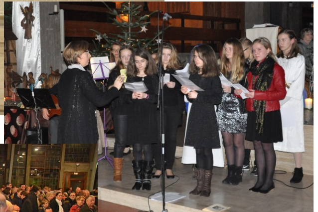
Messe de minuit