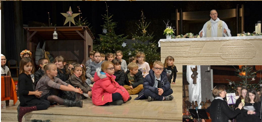
Célébration de 17h