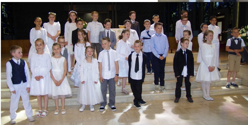
Ils étaient 28 à faire leur première communion le 31 mai à Herrlisheim.