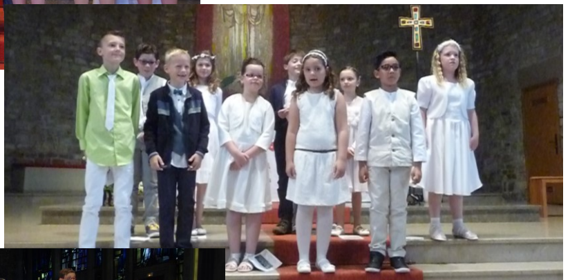
Le 14 mai, jour de l'Ascension, 11 enfants d'Offendorf ont fait leur première communion.