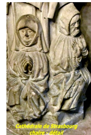
Cathédrale de Strasbourg chaire - détail

Jean-Luc Friderich, prêtre de la communauté de paroisses.