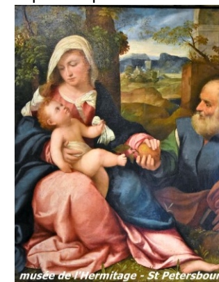
musée de l'Hermitage - St Petersburg